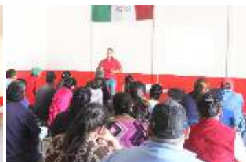
Programas Bien Empleo y Punto de Venta

Se dio a conocer ante la población en general los programas sociales de Bien Empleo y Punto de Venta, para todas las microempresas de nuestro municipio y sus delegaciones.