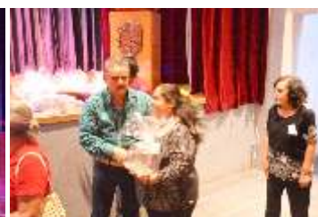
Exposición de declamación con el tema: "10 de mayo Día de las Madres"

El presidente municipal Profr. Alejandro Ocampo Aldana expresó su agradecimiento a todos los participantes de manera especial y personal felicitó a todas las mamás del municipio por su día.